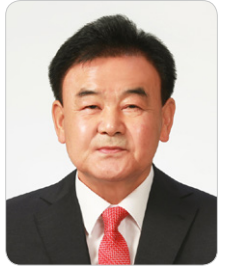
태백시의회 의장 고재창