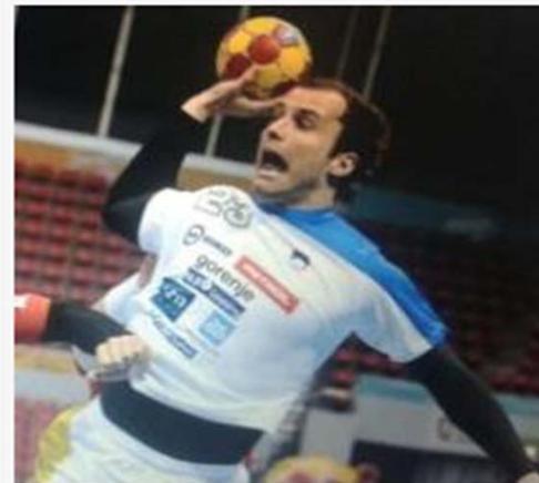
<허용 되지 않음>