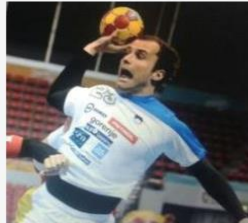
<허용 되지 않음>