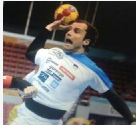
<허용 되지 않음>