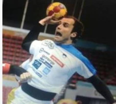
<허용 되지 않음>